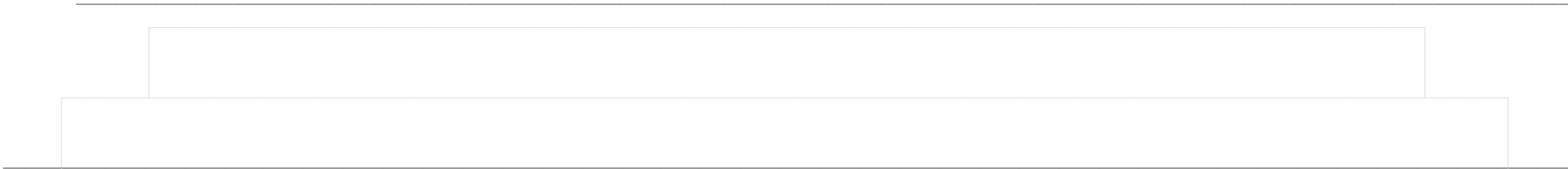
EM52 VAADE 1:20